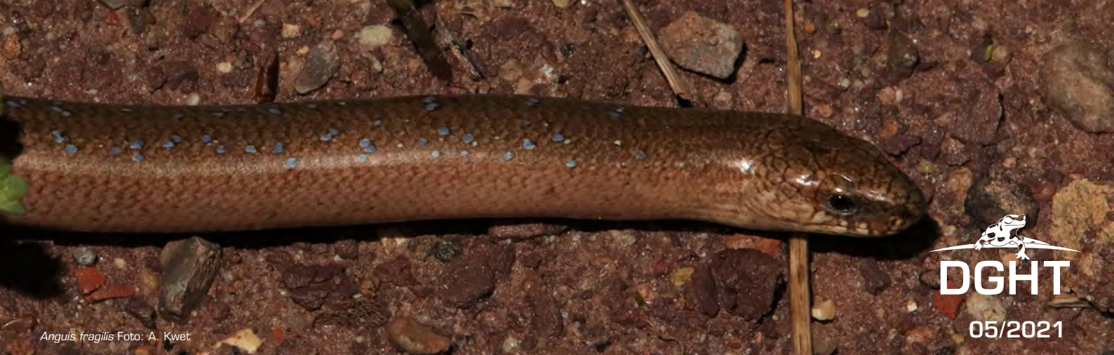
Anguis fragilis