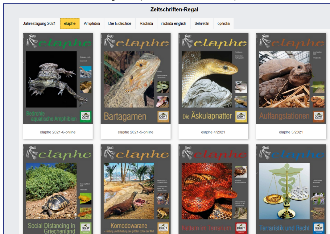
Blick ins Online-Zeitschriftenregal des DGHT-WebKIOSKS mit aktuellen elaphe-Ausgaben

Für unsere fünf Arbeitsgemeinschaften mit den eigenständigen AG-Heften „amphibia“, „Die Eidechse“, „ophidia“, „Radiata deutsch“, „Radiata englisch“ und „Sekretär“ besteht ebenfalls die Möglichkeit, ihre Zeitschriften auf der Yumpu-Plattform digital zu veröffentlichen. Die Entscheidung hierüber liegt jedoch bei den AGs, sodass AG-Mitglieder mit digitaler elaphe ihre AG-Zeitschrift in der Regel weiterhin in Papierform erhalten. Wir werden Sie informieren, sobald auch für die AG-Hefte digitale Angebote vorliegen (bis dahin finden Sie in Ihrem Zeitschriften-Regal von jedem Titel nur ein Beispielheft).